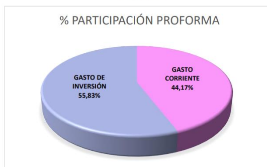
Gráfico No. 9